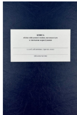
Книга обліку військового майна що видається в тимчасове користування, додаток 16 (додаток 17)