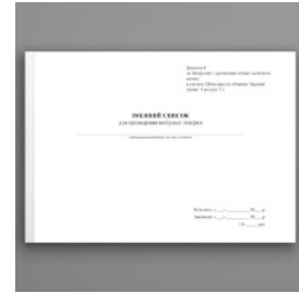
Іменний список для проведення вечірньої повірки, додаток 4