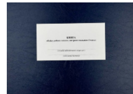
Книга обліку роботи машин витрати пального і масел, додаток 84 (додаток 85)

Перейти до категорії Книги обліку для військових