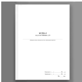
Журнал ведення бойових дій