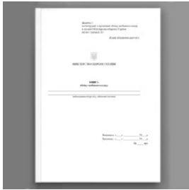
Книга обліку особового складу, додаток 3