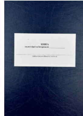
Книга видачі зброї та боєприпасів, додаток 5