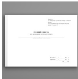
Іменний список для проведення вечірньої повірки, додаток 4