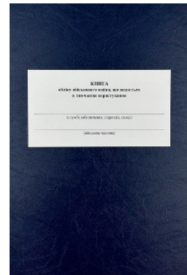
Книга обліку військового майна що видається в тимчасове користування, додаток 16 (додаток 17)

Перейти до категорії Книги обліку для військових