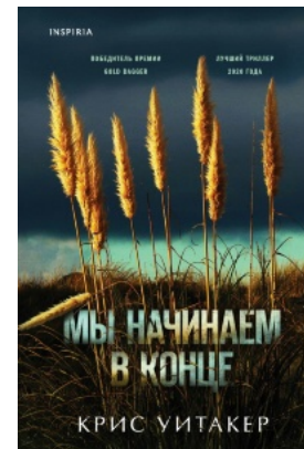
Мы начинаем в конце