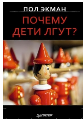
Почему дети лгут?