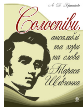
Солоспіви, ансамблі та хори на слова Тараса Шевченка