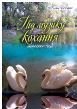
Під музику кохання