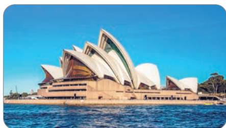
Міста Канберра і Сідней