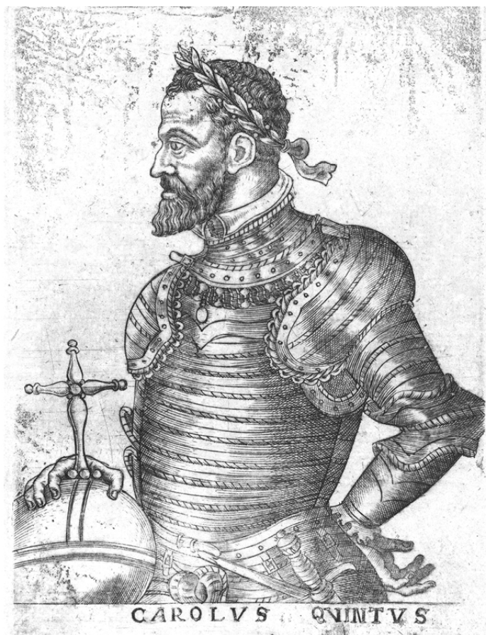
Карл V, рисунок Вермеена Яна Корнелиса, XVI век

А еще Карл воевал с турками — под Веной, в Венгрии, в Тунисе и Алжире, получив за это прозвище Божий знаменосец, активно участвовал в войнах на территории Германии, где лютеранские аристократы сходились в кровавых схватках с католическими правителями. Именно о религиозные войны разбилась мечта Карла о создании империи, которая бы объединила весь континент (уже в XX веке о нем заговорили как об «отце Европы»).