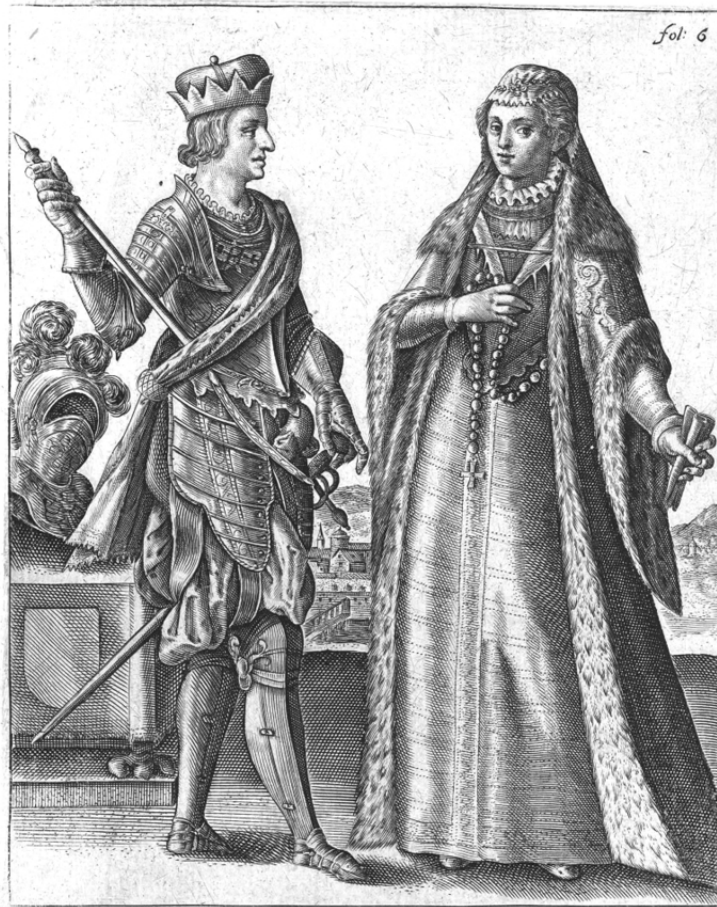
Максимилиан I Габсбург и Мария Бургундская, рисунок начала XVII века

Как свидетельствовали современники, супруги любили друг друга, их отношения были вполне гармоничными, а не основывались просто на трезвом расчете. Максимилиан так описывал внешность своей будущей жены в письме к другу: «Это дама красивая, благочестивая, добродетельная, которой я, благодарение Господу, весьма доволен. Сложением хрупкая, с белоснежной кожей; волосы каштановые, маленький нос, небольшая головка, некрупные черты лица; глаза карие и серые одновременно, ясные и красивые. Нижние веки чуть припухшие, как будто она только что ото сна, но это едва заметно. Губы чуть полноваты, но свежи и алы. Это самая красивая женщина, какую я когда-либо видел». Кстати, благодаря браку представителя Габсбургов с Марией Бургундской к ее потомкам на австрийском