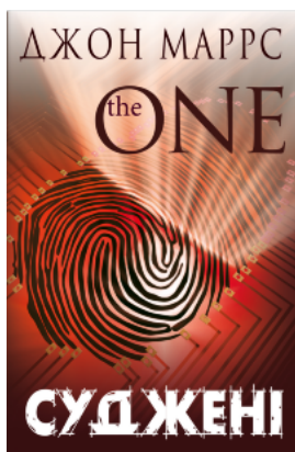
Суджені. The One