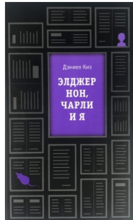
Элджернон, Чарли и я