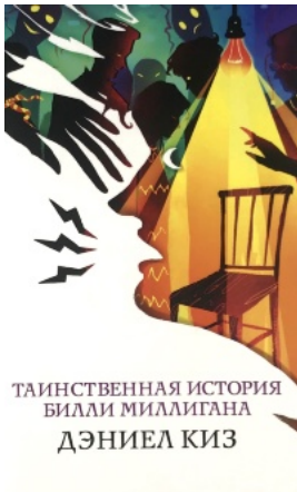
Таинственная история Билли Миллигана