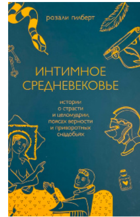
Интимное Средневековье. Истории о страсти и целомудрии, поясах верности и приворотных снадобьях