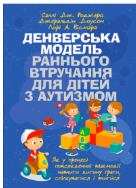
Денверська модель раннього втручання для дітей з аутизмом

Перейти до категорії Аналітична психологія