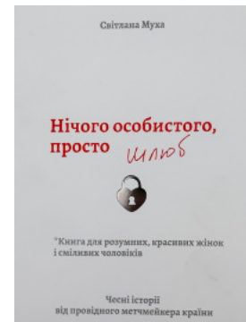
Нічого особистого, просто шлюб