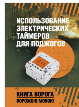
Использование электрических таймеров для поджогов