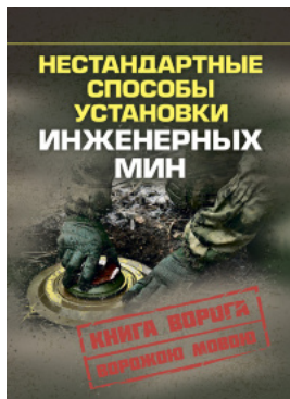
Нестандартные способы установки инженерных мин