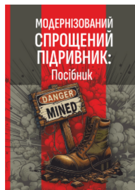
Модернізований спрощений підричник (МСП/МУВ)