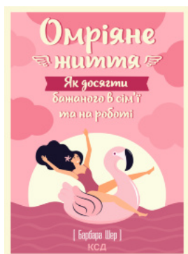
Омріяне життя. Як досягти бажаного в сім'ї та на роботі