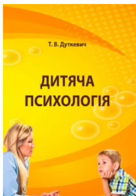
Дитяча психологія. Практикум