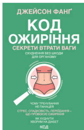
Код ожиріння. Секрети втрати ваги