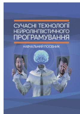
Сучасні технології нейролінгвістичного програмування