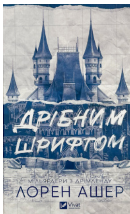
Дрібним шрифтом (Мільярдери з Дрімленду #1)