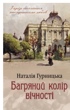
Багрянний колір вічності