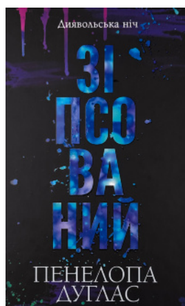
Зіпсований. Книга 1