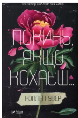
Покинь якщо кохаєш