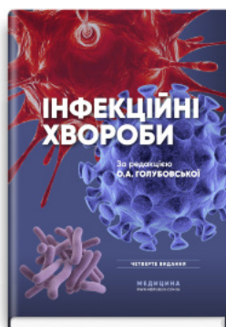
Інфекційні хвороби: підручник