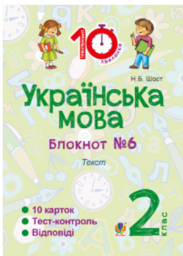
Українська мова. 2 клас. Зошит №6. Текст