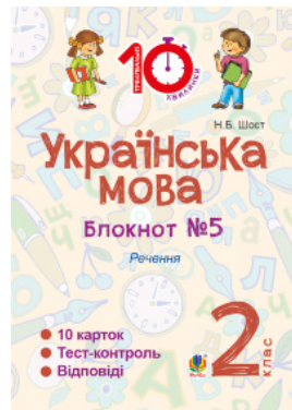
Українська мова. 2 клас. Зошит №5. Речення