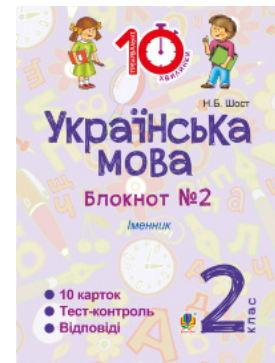
Українська мова. 2 клас. Зошит №2. Іменник