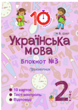
Українська мова. 2 клас. Зошит №3. Прикметник