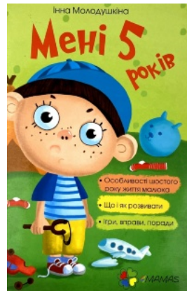
Мені 5 років

Перейти до категорії Біографії і мемуари