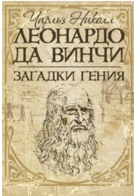
Леонардо да Винчи. Загадки гения