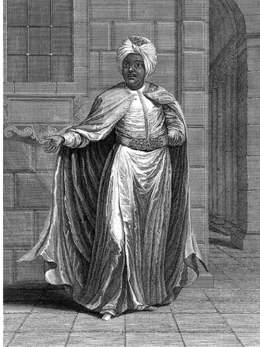
Кизляр-ага. Ж. Б. Ван Мур. 1714 р.

Там довго усіх розпитував, але безрезультатно: ніхто не бачив головного євнуха. Застав Бешира аж біля хамаму хасекі, де той куняв, сидячи у кріслі.