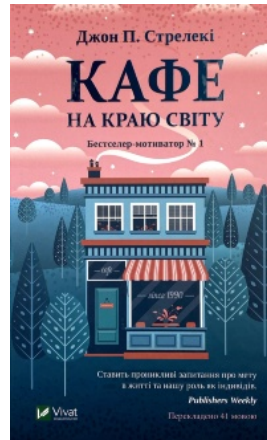
Кафе на краю світу