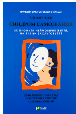
Синдром самозванця. Як прожити неймовірне життя, на яке ви заслуговуєте