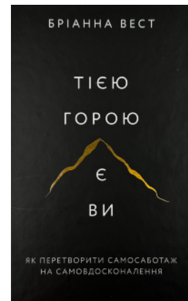
Тією горою є ви. Як перетворити самосаботаж на самовдосконалення