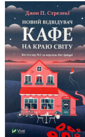
Новий відвідувач кафе на краю світу