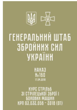
Наказ ГШ ЗСУ № 160 — Курс стрільб зі стрілецької зброї і бойових машин