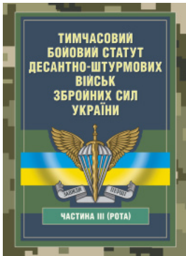
Тимчасовий бойовий статут десантно-штурмових військ Збройних Сил України, частина III (рота)