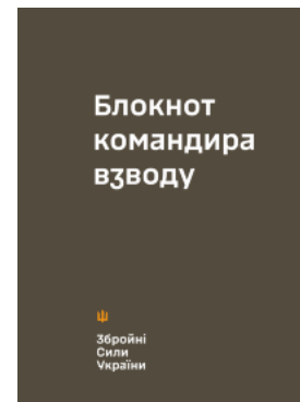
Блокнот командира взводу (ЗСУ)