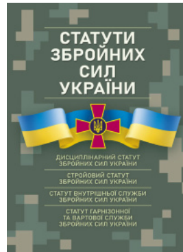
Статути збройних сил України