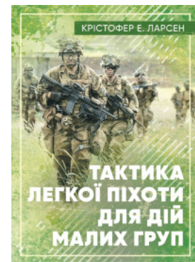
Тактика легкої піхоти для дій малих груп