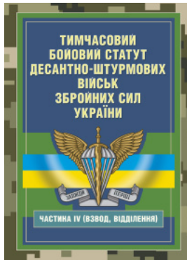
Тимчасовий бойовий статут Десантно-штурмових військ Збройних Сил України, частина IV (Взвод, відділення)