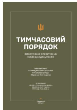
Наказ ГК № 140 — Тимчасовий порядок оформлення оперативних (бойових) документів