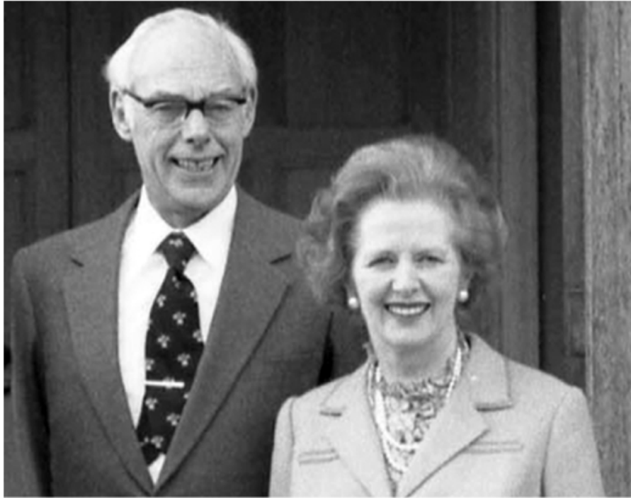
Маргарет и Денис Тэтчер на пороге Даунинг-стрит, 10