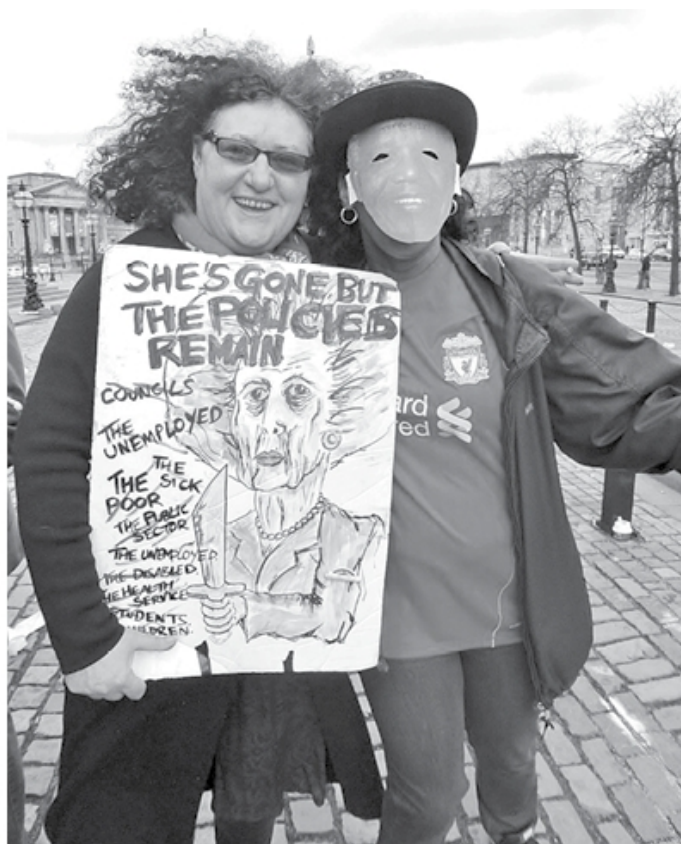
Празднование смерти Маргарет Тэтчер в Ливерпуле