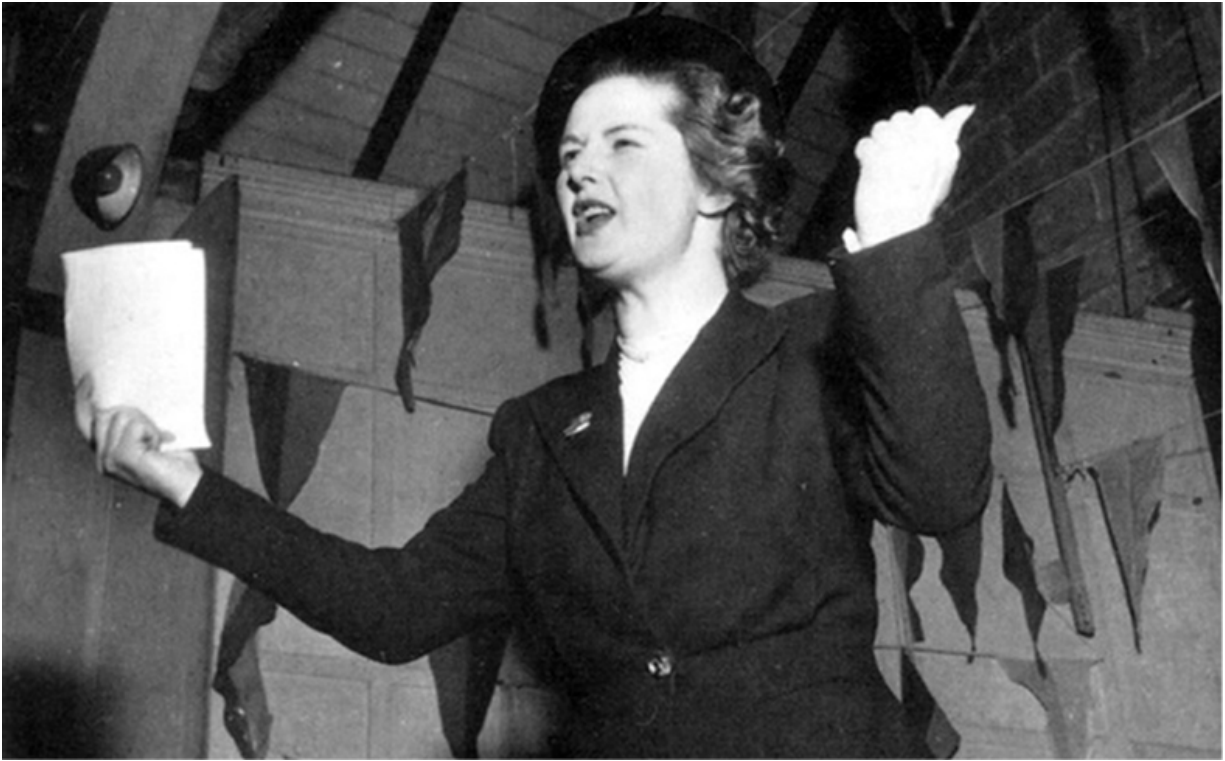
Маргарет Робертс выступает перед избирателями Дартфорда, 1951 год