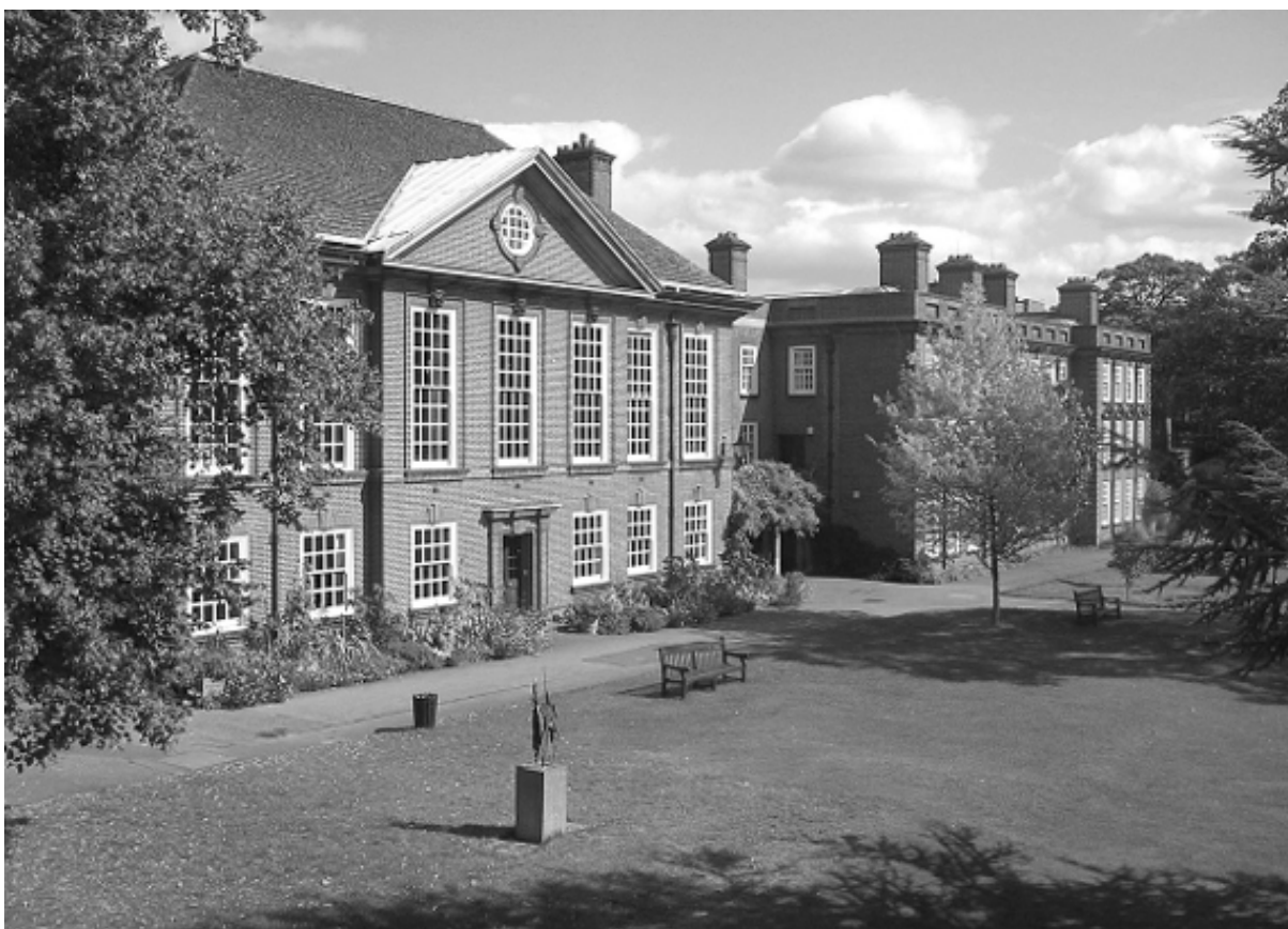
Соммервилл-колледж, Оксфорд. Здесь Маргарет Робертс училась в 1943—1947 годах