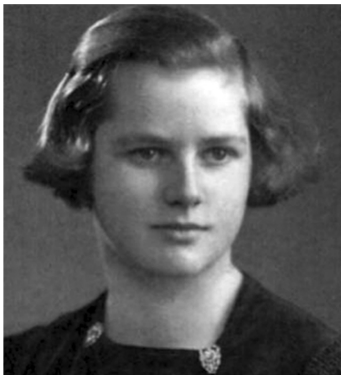
Маргарет Робертс в 1938 году