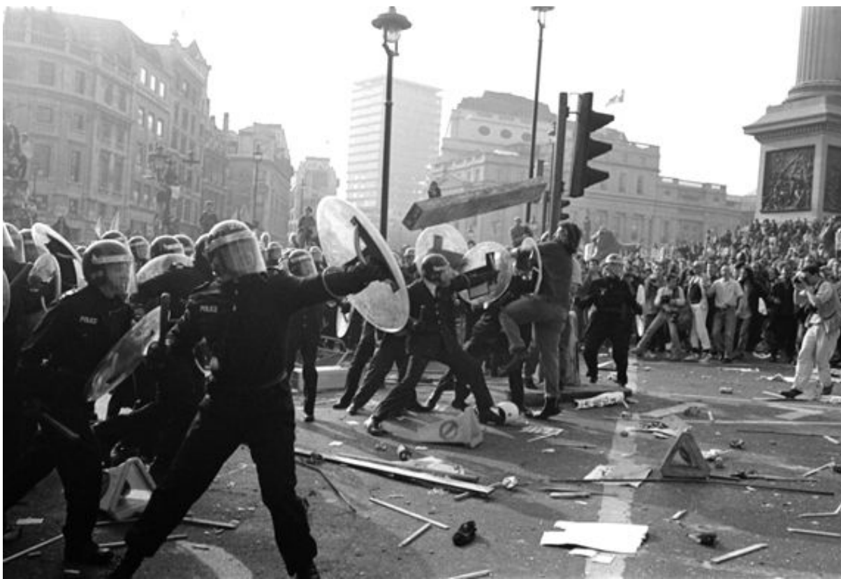
Трафальгарская площадь в Лондоне 31 марта 1990 года. Полиция и протестующие выясняют недостатки системы общественного сбора