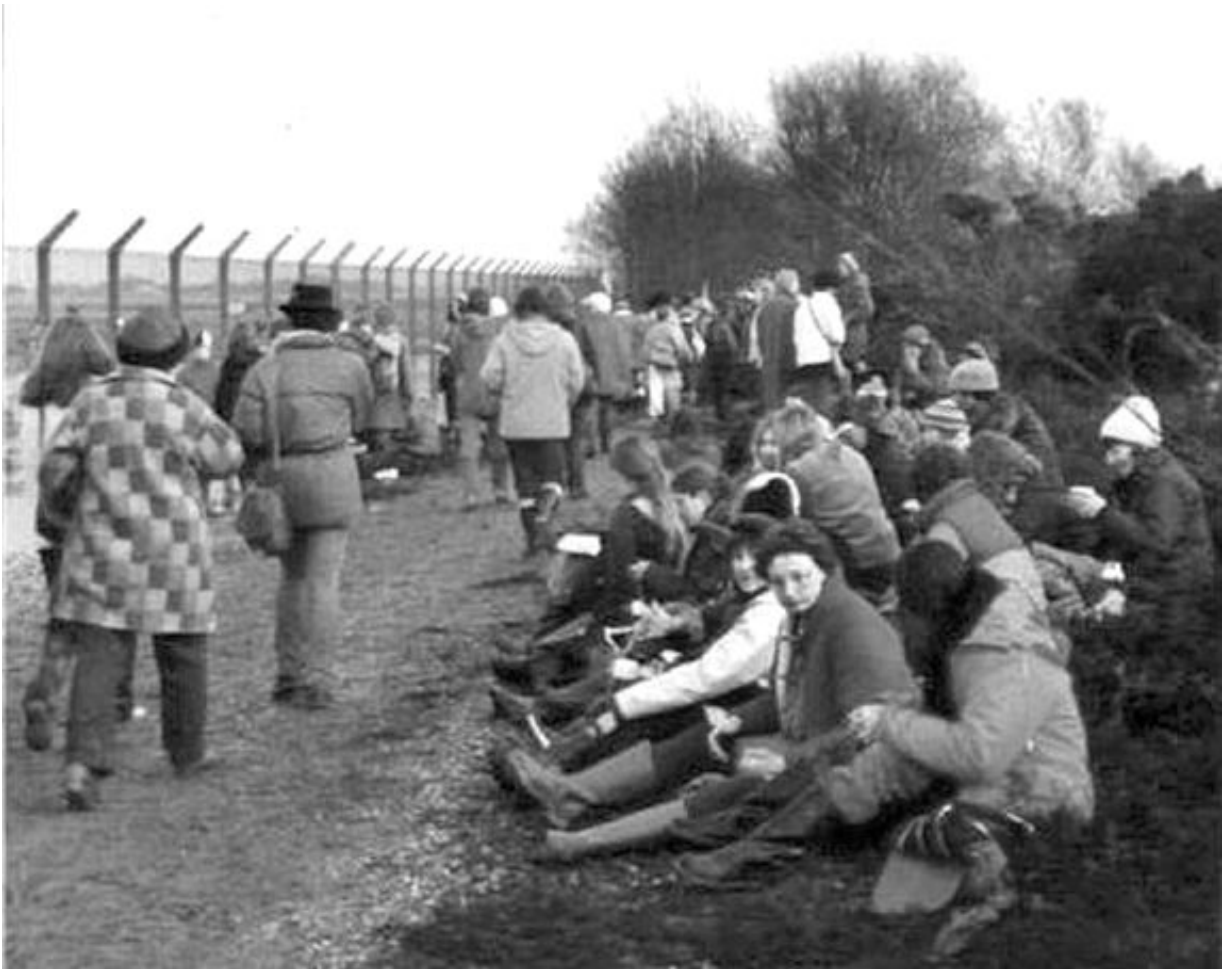
Женщины, протестующие против американских крылатых ракет средней дальности, база Гринэм-Коммон