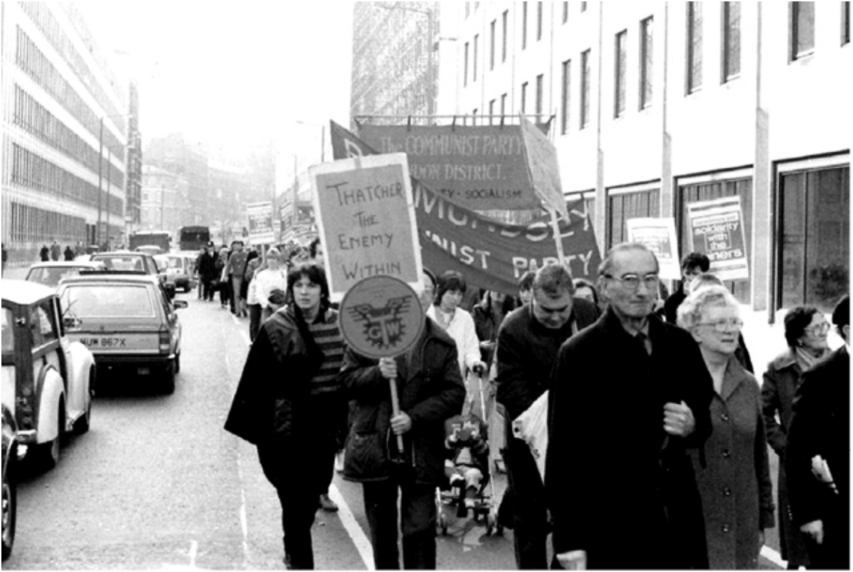
Демонстрация в Лондоне в поддержку бастующих шахтеров, 1984 год