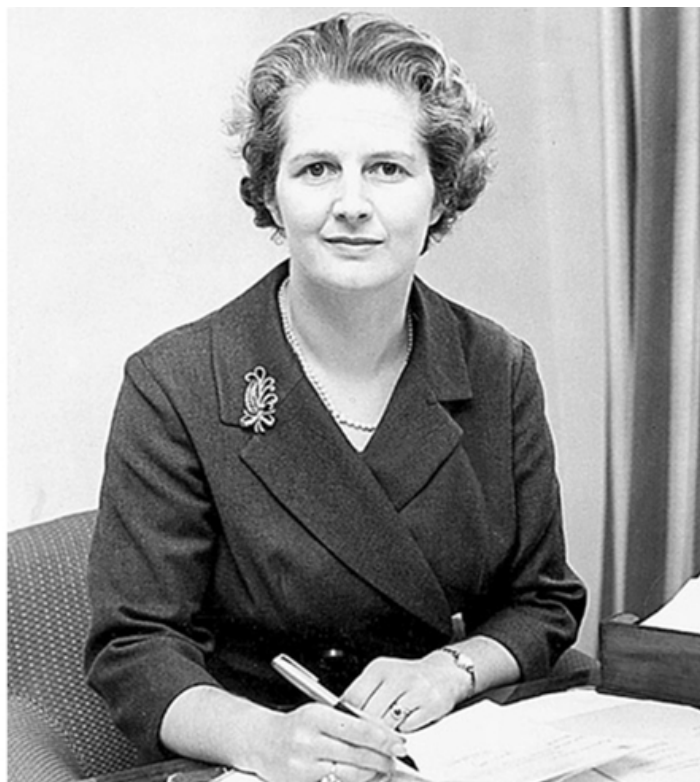
Маргарет Тэтчер — член парламента, 1961 год