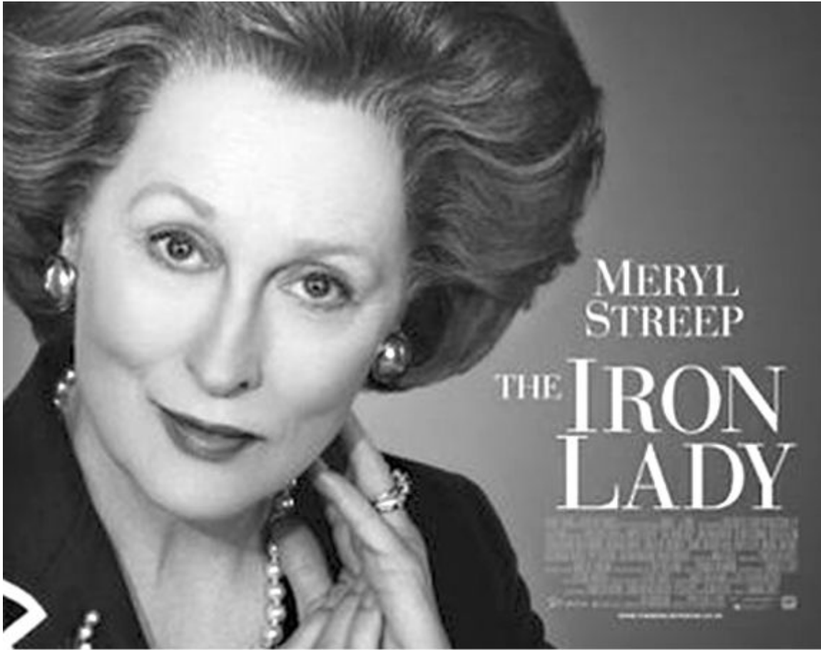
Мерил Стрип получила премию «Оскар» за роль Маргарет Тэтчер в фильме «Железная леди»