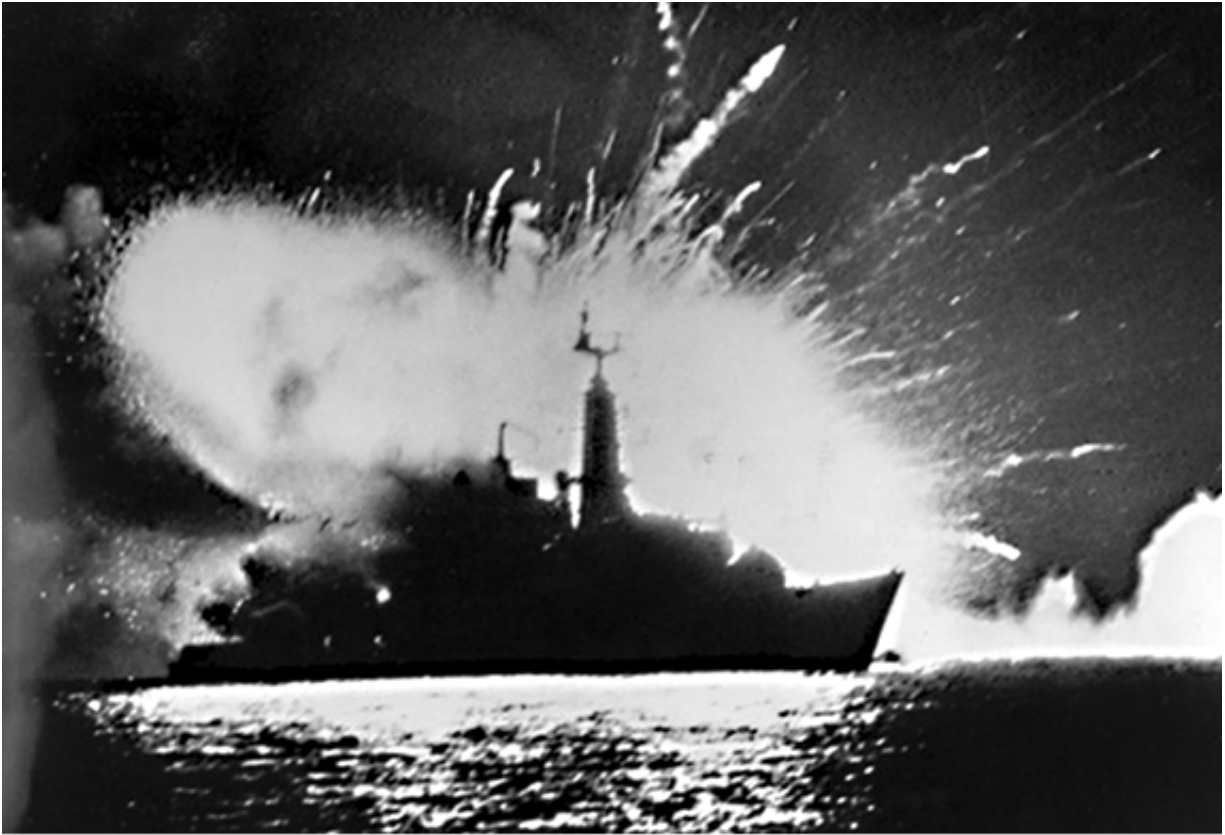
Взрыв аргентинской бомбы на британском эсминце «Ардент» в день высадки британского десанта на Восточном острове 21 мая 1982 года