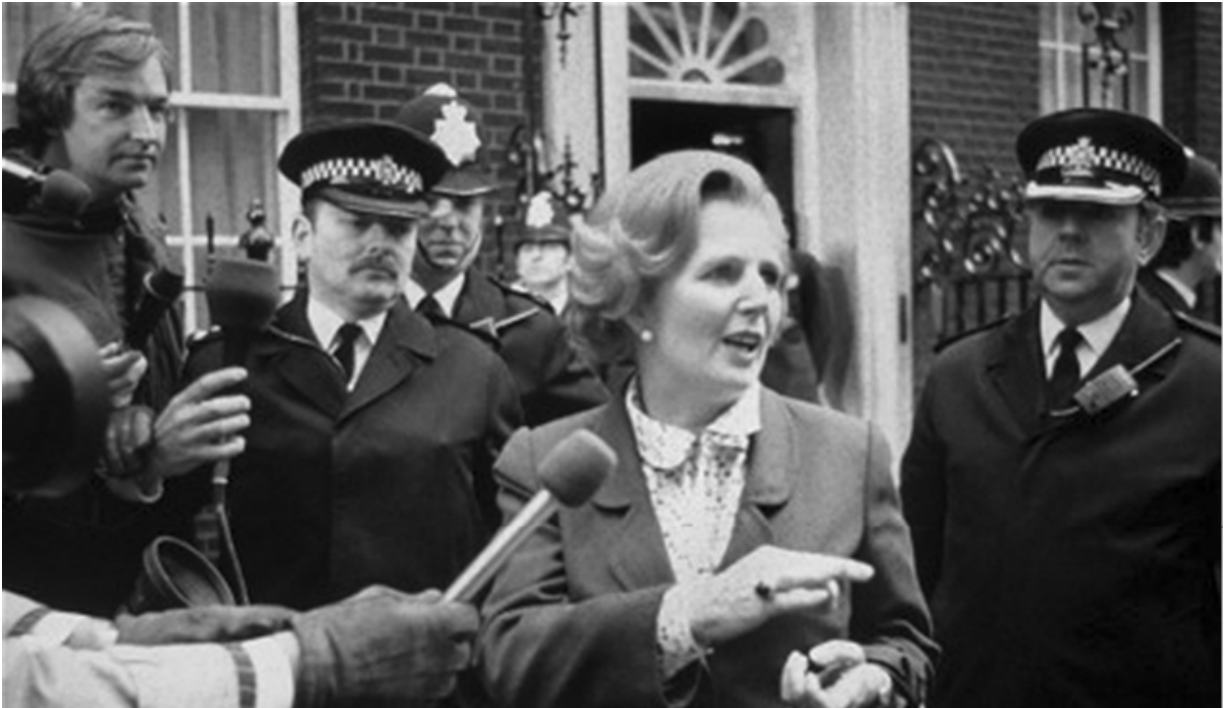
Даунинг-стрит, 10, 4 мая 1979 года, в первый день одиннадцатилетнего проживания по этому адресу