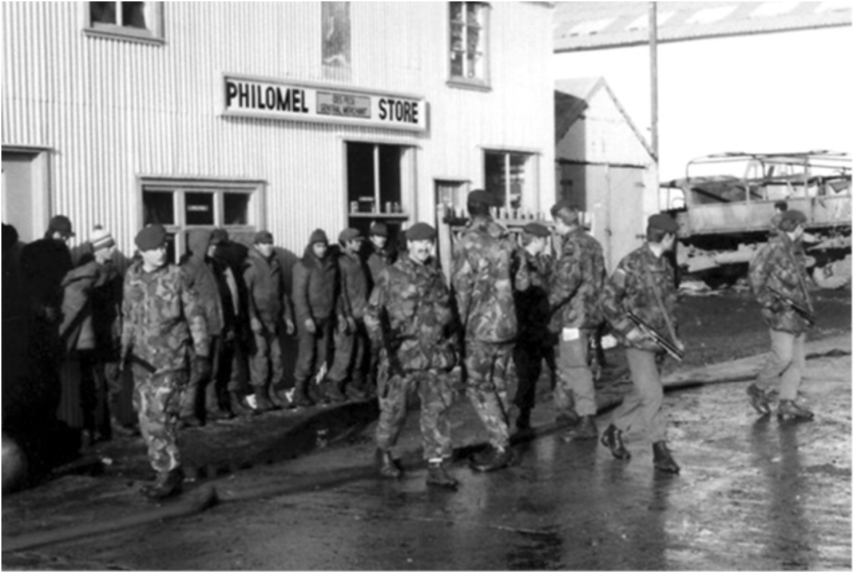
Британские парашютисты охраняют аргентинских военнопленных. Порт-Стэнли, июнь 1982 года