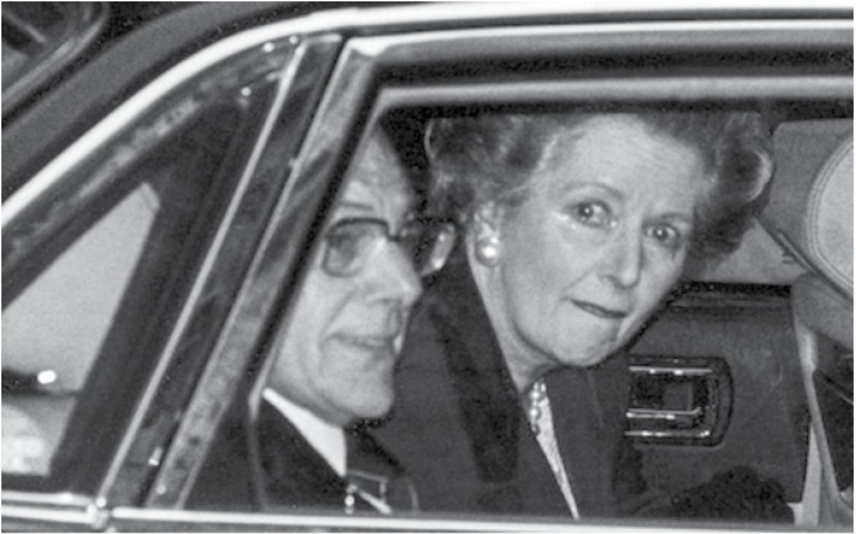
Маргарет и Денис Тэтчер покидают Даунинг-стрит, 10 навсегда. 28 ноября 1990 года