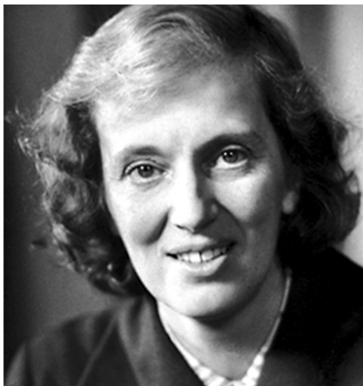
Дороти Ходжкин, лауреат Нобелевской премии по химии 1964 года. Под ее руководством Маргарет Робертс училась в 1943—1947 годах