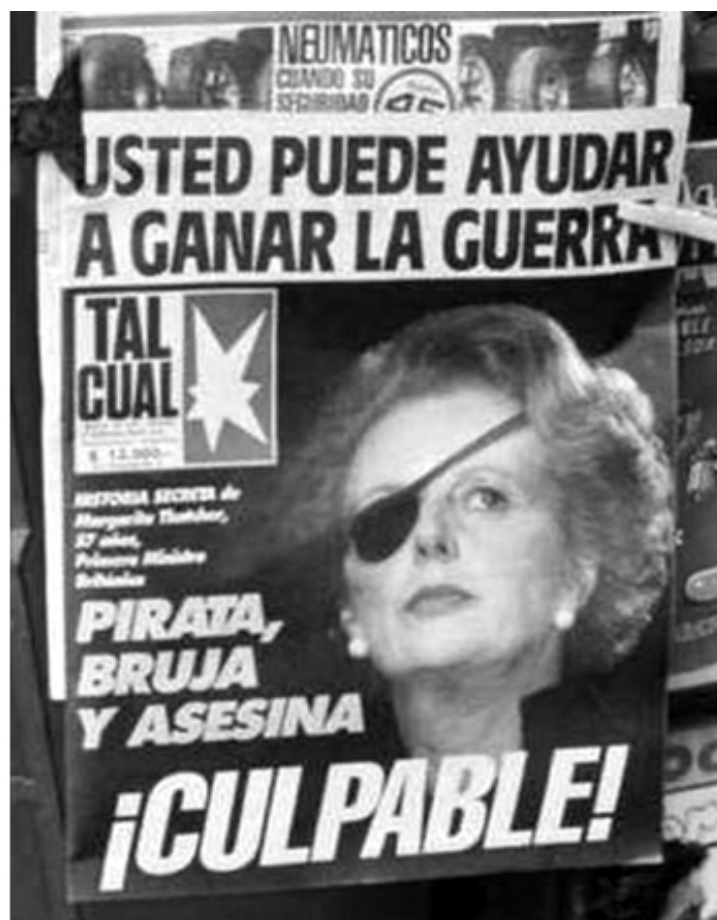
Маргарет Тэтчер на первой полосе аргентинского бульварного издания Tal Cual после потопления крейсера «Генерал Бельграно»