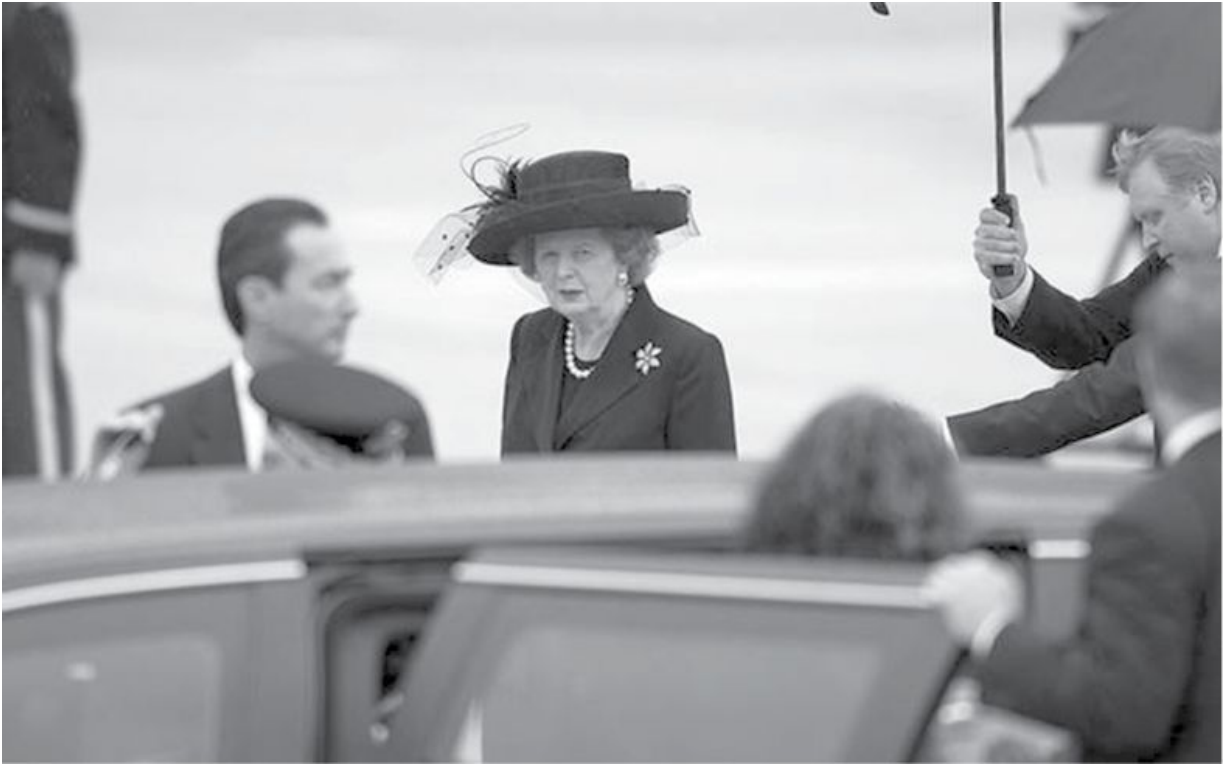
Леди Тэтчер во время похорон своего друга президента Рейгана 9 июня 2004 года