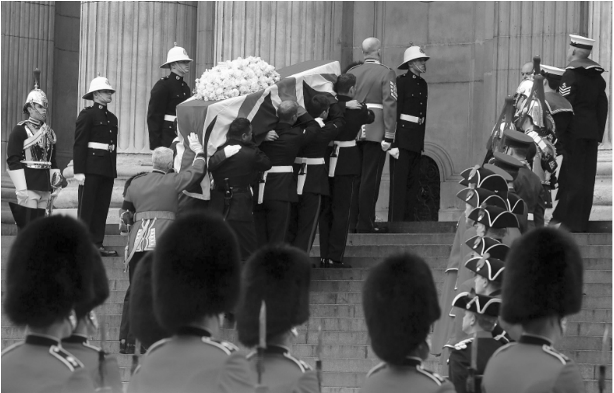
Гроб с телом баронессы Тэтчер вносят в собор Святого Павла. Лондон, 17 апреля 2013 год