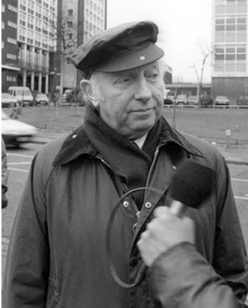
Артур Скаржилл, инициатор забастовки шахтеров