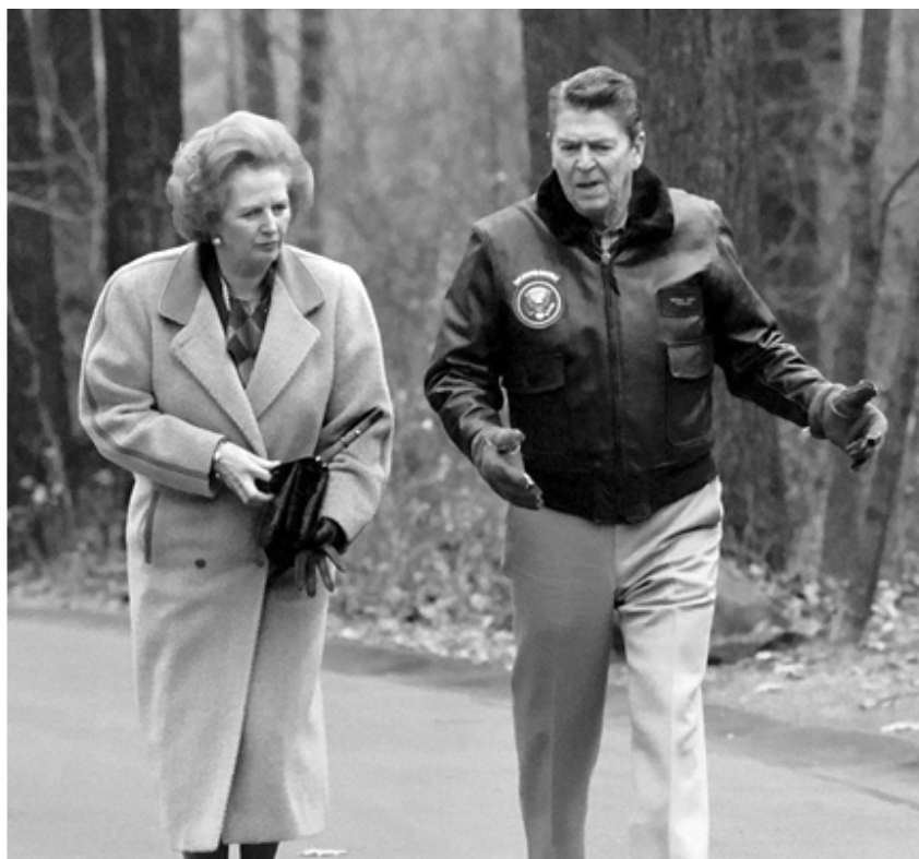
Американский президент Рональд Рейган и Маргарет Тэтчер в загородной резиденции американских президентов Кэмп Дэвид, 1986 год