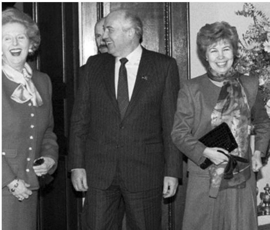
Маргарет Тэтчер и Михаил и Раиса Горбачевы во время визита советского лидера в Британию в 1989 году