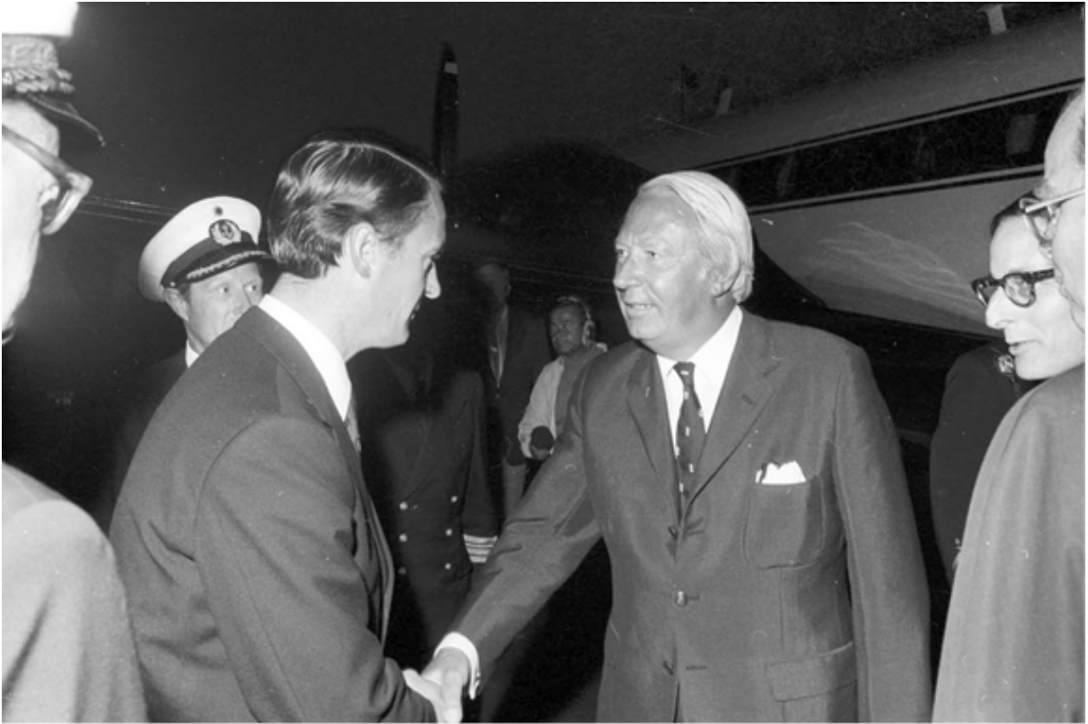
Премьер-министр Эдвард Хит в ходе визита в Западную Германию в 1972 году. Вступление Британии в Европейские сообщество было высшим достижением его правительства