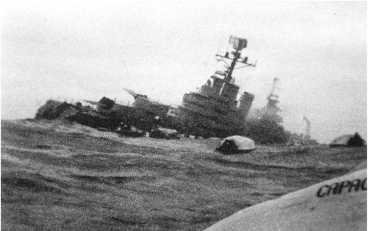
Аргентинский крейсер «Генерал Бельграно» был потоплен торпедами британской подводной лодки 2 мая 1982 года