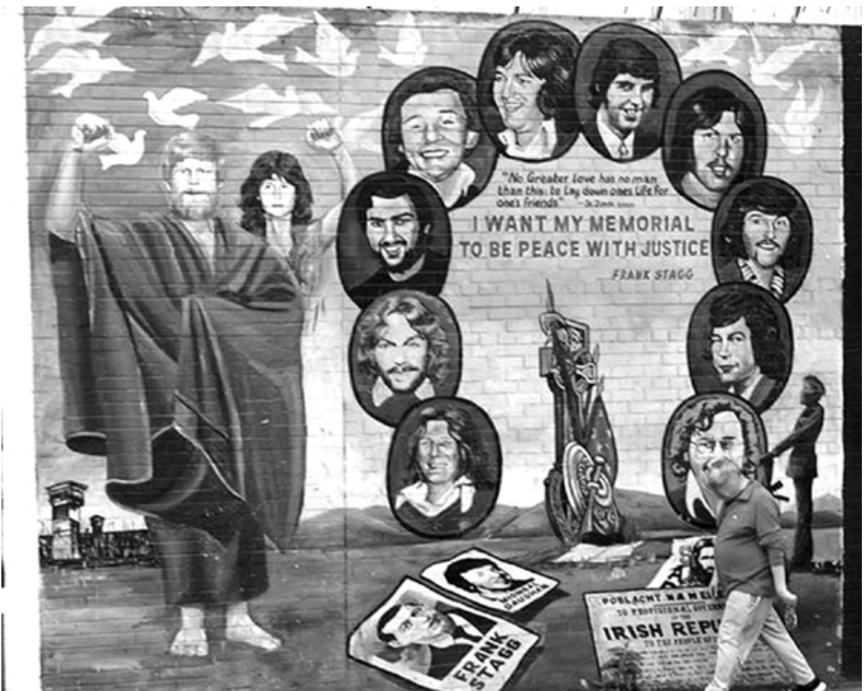
Современный мурал в Белфасте, посвященный участникам голодовки заключенных ирландских республиканцев в 1981 году. Слева внизу — Бобби Сэндс, первый из голодающих, избранный депутатом британского парламента во время голодовки