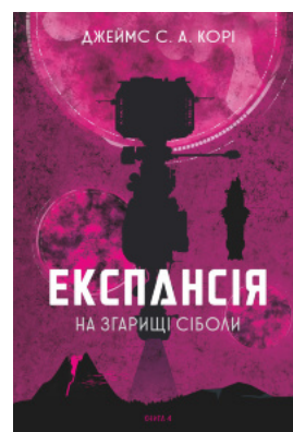
Експансія. Кн.4. На згарищі Сіболи