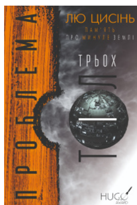
Проблема трьох тіл