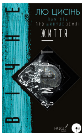
Вічне життя Смерті