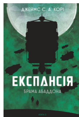
Експансія. Кн. 3