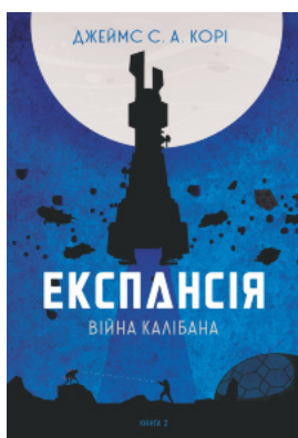
Експансія. Кн. 2