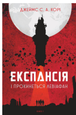
Експансія. Кн. 1