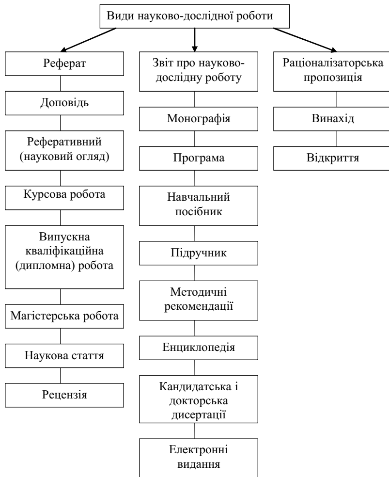
Рис. 1.2. Основні види наукової та науково-методичної роботи

ституту (університету). Але це зазвичай обсяг у межах 10 сторінок комп'ютерного (рукописного) тексту. Бажано, щоб реферат мав спеціально оформлену титульну сторінку і був структурований.