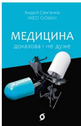
Медицина доказова і не дуже