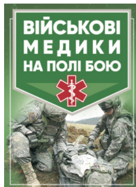
Військові медики на полі бою