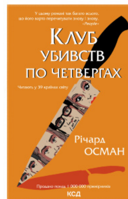
Клуб убивств по четвергах