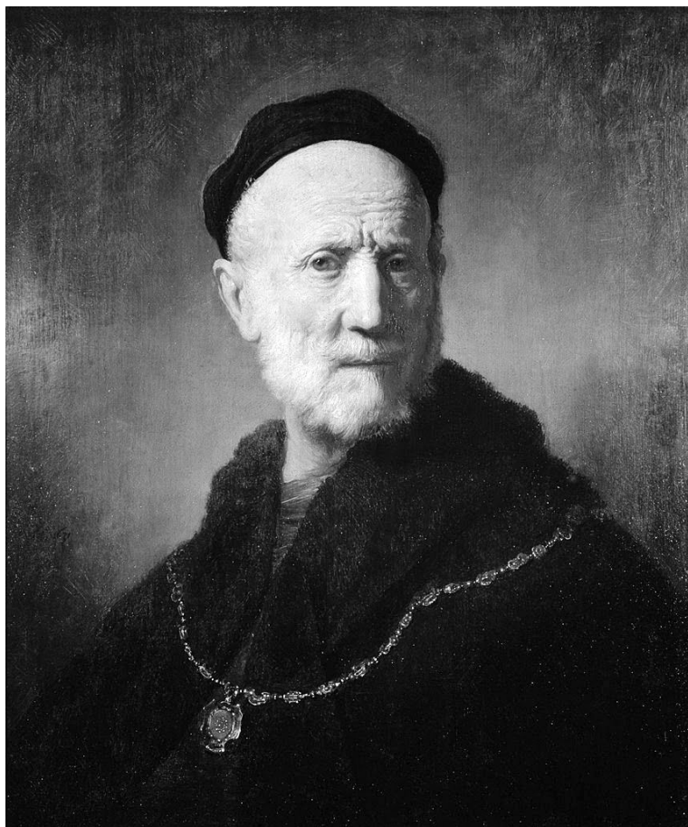
Рембрандт. Отец (1631).