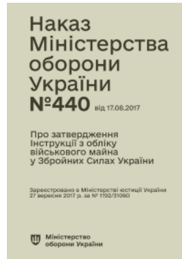
Наказ МОУ № 440 — Інструкція з обліку військового майна у ЗСУ