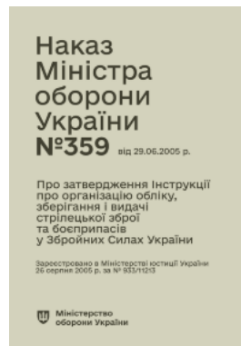
Наказ МОУ № 359 — Інструкція про організацію обліку, зберігання і видачі стрілецької зброї та боєприпасів у Збройних Силах України