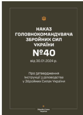
Наказ ГШ ЗСУ № 40 — Інструкція з діловодства у Збройних Силах України (2024 рік)