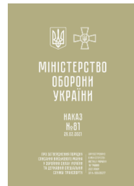
Наказ МОУ № 81 — Порядок списання військового майна у ЗСУ та ДССТ