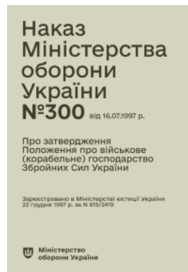
Наказ МОУ № 300 — Положення про військове (корабельне) господарство ЗСУ