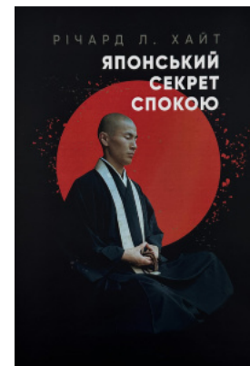
Японський секрет спокою