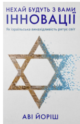
Нехай будуть з вами інновації. Як ізраїльська винахідливість рятує світ