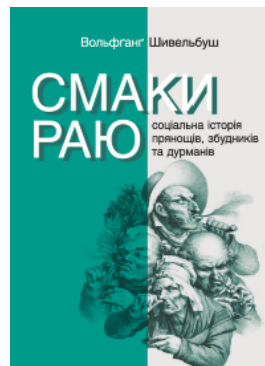
Смаки раю. Соціальна історія прянощів, збудників та дурманів