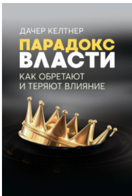
Парадокс власти. Как обретают и теряют влияние