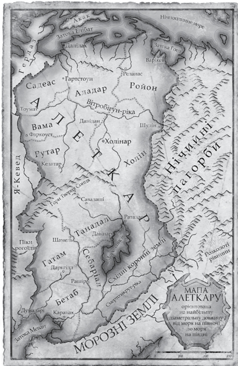
Мапа Алеткару й околиць, намальована землемірами Його Королівської Величності Гавіларом Холіном близько 1167 року.