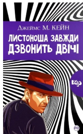
Листоноша завжди дзвонить двічі