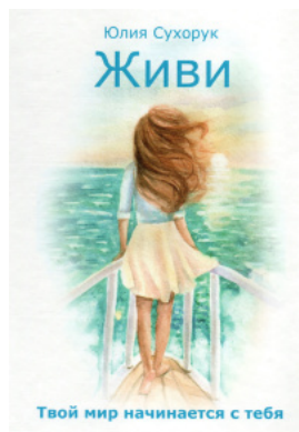
Живи. Твой мир начинается с тебя