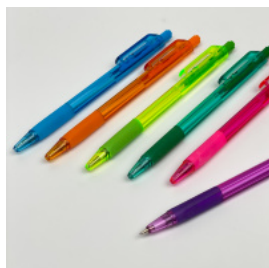
Ручка шариковая TriClick