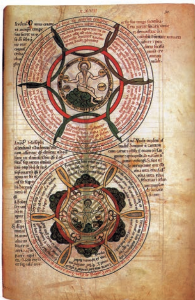
Семь мировых веков и соответствующие им периоды жизни человека. Ламберт из Сент-Омера, 1120.

Давайте назовем величайших мировых поэтов: Гомер, Калидаса, Ли Бо, Абу Нувас, Данте, Гете и др. Они образуют 500-летний ритм, который совпадает с периодами архангела Анаила. А как иначе, ведь Анаил – это не кто иной, как древневавилонская Инанна-Афродита, богиня любви