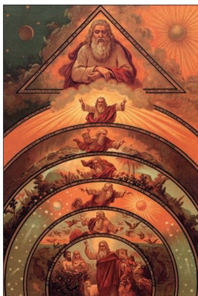
Семь дней творения, XIX век.

На этих курсах ведется работа с творческим воображением, но они имеют один недостаток. Они больше ищут приятные душевные состояния и представления, чем истину, и не задают себе вопроса: соответствуют ли эти видения прекрасных существ чему-то реальному, или они существуют лишь в моей голове? Как мне отличить настоящее откровение от фантазии?