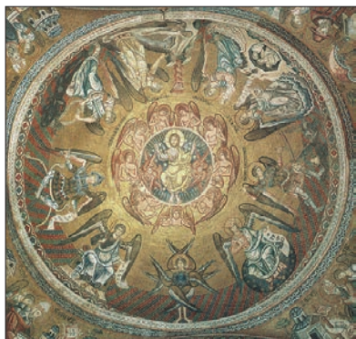
Девять ангельских хоров и их характерные деяния. Купол собора св. Марка, Венеция, XIII век.

ла не в результате «Большого взрыва», но возвышенные сущности, прообразы добродетелей, пропели, вымолвили ее как произведение искусства. Природа была живой, одушевленной, осмысленной, – а вовсе не машиной или цепной химической реакцией. Человек был не побочным продуктом гонки вооружений между эгоистичными генами, а венцом творения.