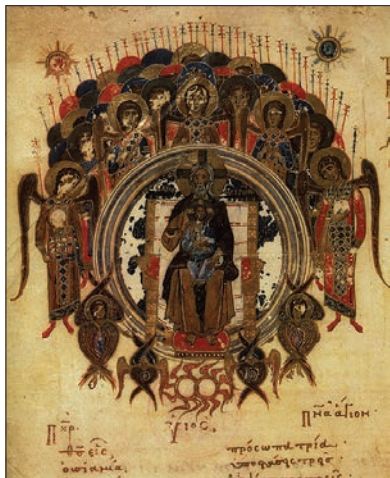
Бог Отец как Ветхий днями в окружении ангельских хоров. Греческая иллюстрация XII века.

Как великие духи времени архангелы чередуются в периодах по 354 года, о которых говорит Тритемий. Их очередь приходит каждые 7 \times 354,3 = 2480 лет. Последовательность великих духов времени, однако, иная. Если мы представим себе планетные сферы как семь тонов небесной гаммы, то эта последовательность образует в музыке сфер квинтовый круг: Орифиил, Анаил, Захариил, Рафаил, Самаил, Гавриил, Михаил. Об этом великом круге говорил и Будда, когда провозглашал, что великое колесо дхармы оборачивается один раз за 25 веков и в каждом цикле приходит один новый будда. Геродот намекает, что египтяне знали об этом круге уже в архаический период.