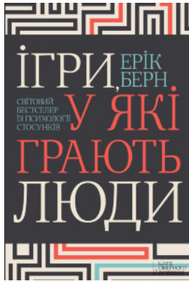
Ігри, у які грають люди