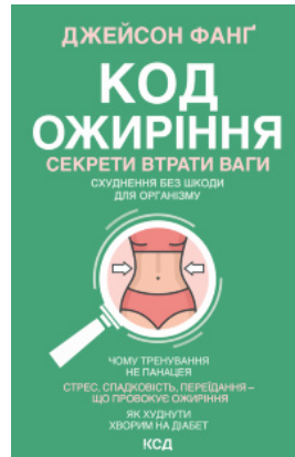
Код ожиріння. Секрети втрати ваги