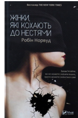
Жінки, які кохають до нестями