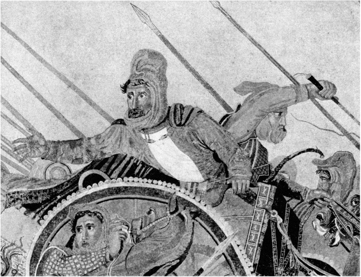
Дарий III. Фреска в Помпеях

После победы Александра под Гавгамелами его армии открыли ворота Вавилон и Сузы. Александру — новому владельцу Азии — присягали персидские вельможи.