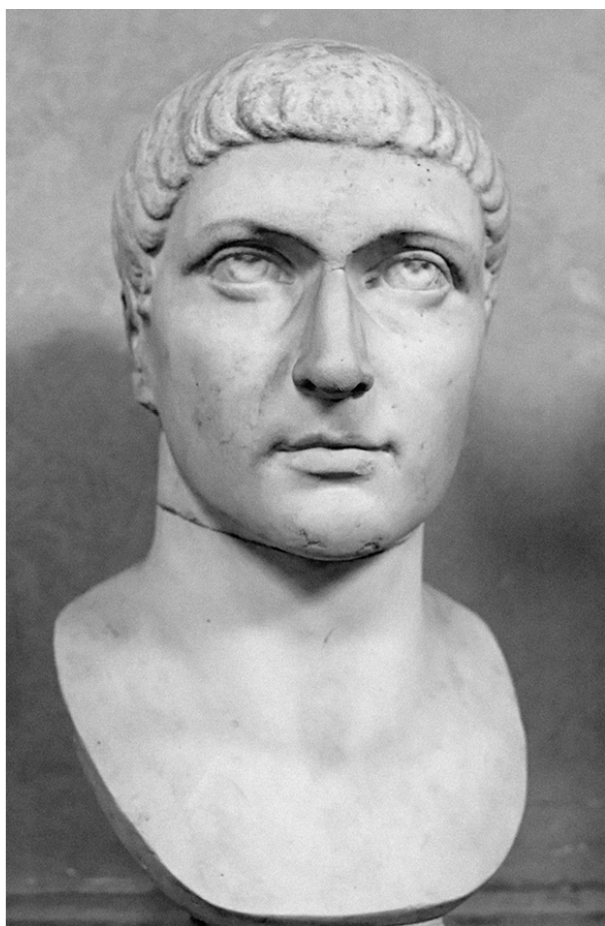
Бюст Константина Великого

В ряде сражений Константин разгромил силы одного из противников, Максенция. Решающая битва произошла у Мильвийского моста близ Рима. Говорят, что Константин опасался колдовства Максенция, который для своих нечестивых гаданий рассекал младенцев. В шестом часу дня Константин вдруг увидел крест из света с надписью: «Сим побеждай!» А ночью ему явился Христос и сказал: «При помощи явившегося тебе побеждай!» Утром Константин созвал мастеров и, описав им видение, приказал сделать знамя с крестом, а на щиты воинов нанести хризму — монограмму имени Христа. В сражении силы противников Константина были разбиты, их предводитель попытался бежать, но мост обрушился, и Максенций утонул в Тибре.