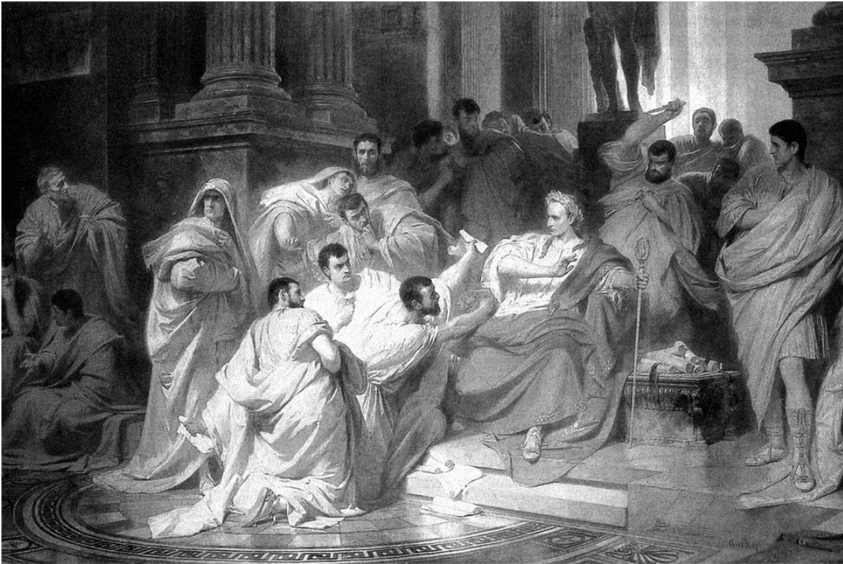
Убийство Цезаря (Карл Теодор Пилоти)

Один из сторонников Цезаря, знавший о готовящемся заговоре, протянул ему свиток, где подробно рассказал обо всем. Но Цезарь не успел прочесть. Местом убийства Цезаря стала курия Помпея. Здесь же находилась его статуя. Говорят, что перед убийством Кассий посмотрел на статую и призвал его в помощники. Первым удар Цезарю нанес Публий Сервий Каска. Цезарь сопротивлялся, но когда увидел Брута, то, по преданию, сказал: «И ты, дитя мое!» Непосвященные в заговор сенаторы застыли от страха. Тело Цезаря было отброшено к подножию статуи Помпея, которая оказалась сильно забрызгана кровью. Казалось, что сам Помпей отомстил своему противнику. Заговорщики нанесли Цезарю двадцать три раны и при этом сами изранили друг друга.