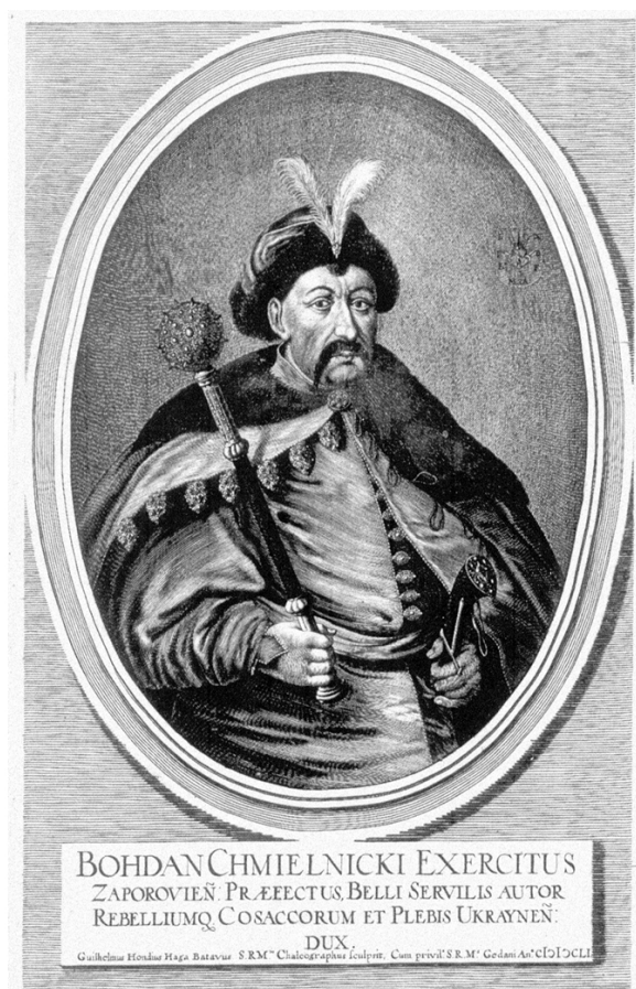
Богдан Хмельницкий (Вильгельм Гондиус)

Напряжение между польской шляхтой и казаками нарастало. Сейм постепенно урезал все обещанные запорожцам привилегии. Чтобы сдерживать казаков, польские власти возвели на Днепре крепость Кодак, которую называли ключом к Запорожью. Коронный гетман Конецпольский, осматривая твердыню, спросил, что думают о ней казаки. На что Хмельницкий ответил латинским афоризмом Manu facta manu destruat , что означает «руками построенное руками и разрушить можно». Говорят, этот ответ очень не понравился шляхтичу Чаплинскому. Ночью он схватил Хмельницкого и бросил в тюрьму. Но Богдан выбрался на волю и обратился с жалобой на своеволие Чаплинского к королю. Тот, выслушав обе стороны, постановил в качестве наказания сбрить Чаплинскому один ус. Шляхтич несколько