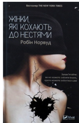
Жінки, які кохають до нестями