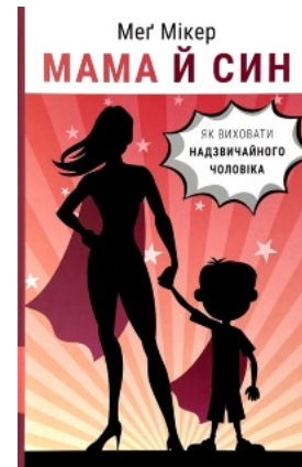
Мама й син. Як виховати надзвичайного чоловіка