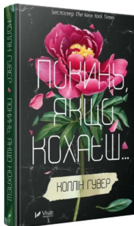
Покинь якщо кохаєш