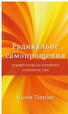
Радикальне самопрощення. Прямий шлях до істинного прийняття себе