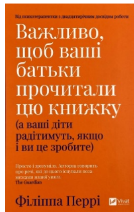
Важливо, щоб ваші батьки прочитали цю книжку (а ваші діти радітимуть, якщо і ви це зробите)