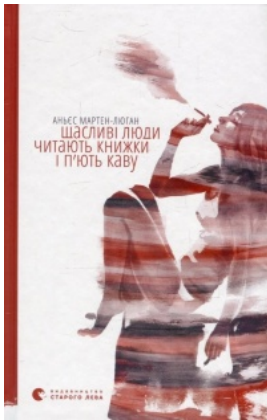
Щасливі люди читають книжки і п'ють каву