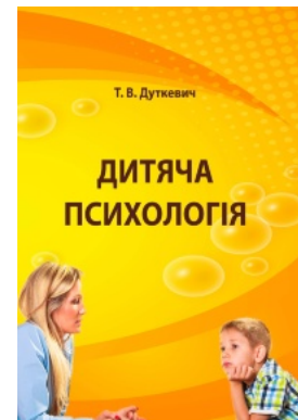
Дитяча психологія. Практикум