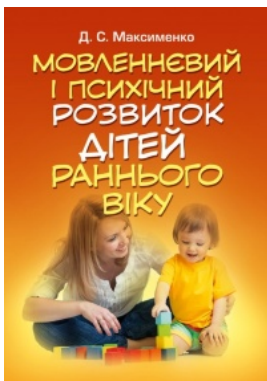
Мовленнєвий і психічний розвиток дітей раннього віку