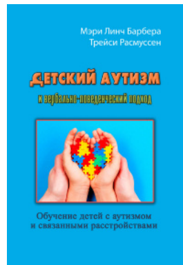
Детский аутизм и вербально-поведенческий подход