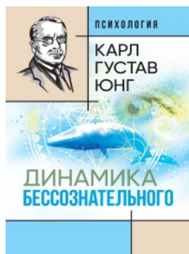
Динамика бессознательного: [сборник]