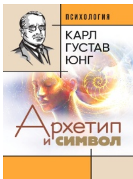
Архетип и символ