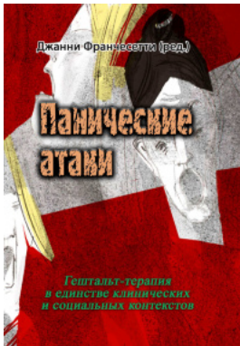
Панические атаки (Гештальт-терапия в единстве клинических и социальных контекстов)