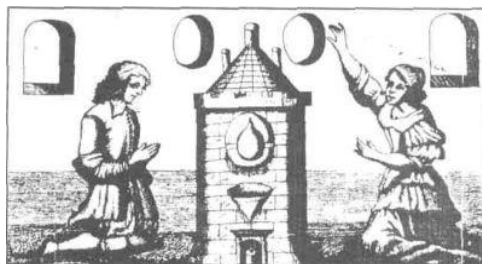
Рис.2- Пара алхимиков, стоящих перед печью на коленях и вымаливающих Божье благословение. Mutus liber (1702)

1 Для читателя, знакомого с аналитической психологией, нет нужды в каком бы то ни было введении, поясняющем предмет данного исследования. Но для читателя, интерес которого