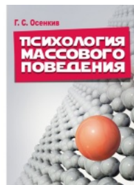
Психология массового поведения