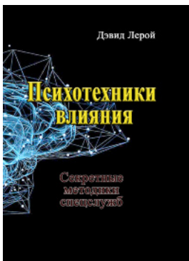
Психотехники влияния. Секретные методики спецслужб