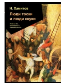
Люди тоски и люди скуки