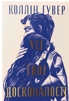
Усі твої досконалості