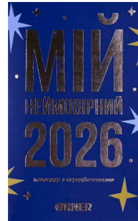
Календар з передбаченнями «Мій неймовірний 2026 рік»