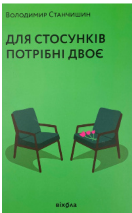
Для стосунків потрібні двоє