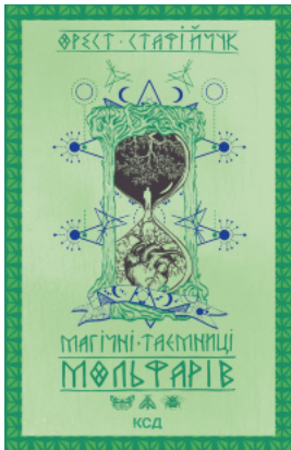
Магічні таємниці мольфарів