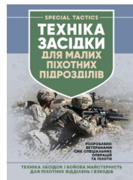
Техніка засідки для малих піхотних підрозділів

Перейти до категорії Військова психологія