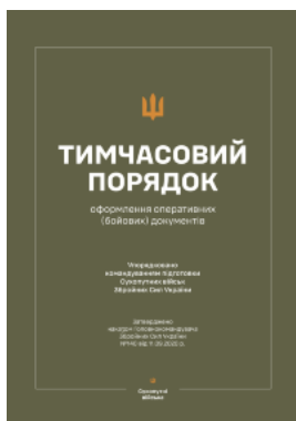
Наказ ГК № 140 — Тимчасовий порядок оформлення оперативних (бойових) документів