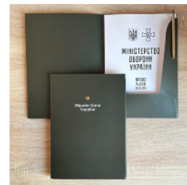
Папка для документів (військовим)