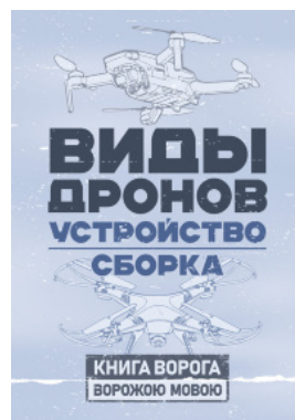
Виды дронов. Устройство. Сборка