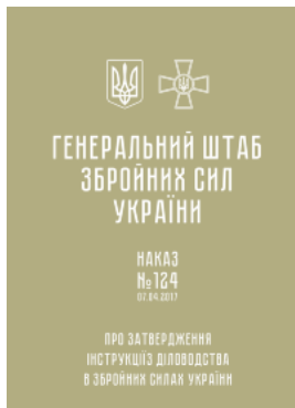
Наказ ГШ ЗСУ № 124 — Інструкція з діловодства у Збройних Силах України (2017 рік)