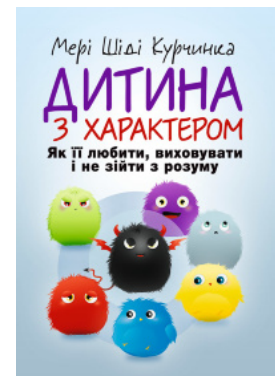
Дитина з характером. Як її любити, виховувати і не зійти з розуму