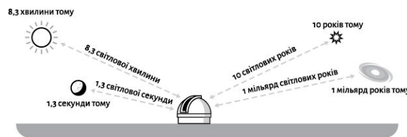
Рис. 1: Аберційний час (час, за який світло долає відстань). Ми інколи виражаємо відстань у світлових секундах, світлових хвилинах і світлових роках, тому що так зрозуміліше, скільки часу знадобилося світлу, щоб дійти до нас від об'єкта, і відповідно — наскільки далеко в минуле ми заглядаємо. (Усі ілюстрації в цій книжці будуть не в масштабі!)

сантиметрів за наносекунду і, відбиваючись від того, на що ви світите, летить до вас із приблизно такою самою швидкістю. По суті, коли ви на щось дивитесь, то зображення, яке ви бачите — тобто світло, яке відбиває об'єкт і яке доходить до ваших очей, — уже трішки втрачає новизну. Людина, яка сидить в іншому куточку кафе, перебуває відносно вас на кілька наносекунд у минулому — це пояснює, чому в неї такий ностальгійний вираз обличчя й такий немодний одяг. Коли ви дивитесь на Місяць — ви бачите його версію трішки більш ніж секундної давності. А зірки на небі взагалі далеко в минулому, від кількох років до тисячоліть.