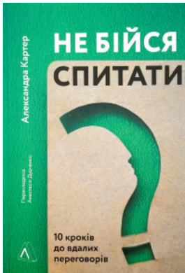
Не бійся спитати. 10 кроків до вдалих переговорів