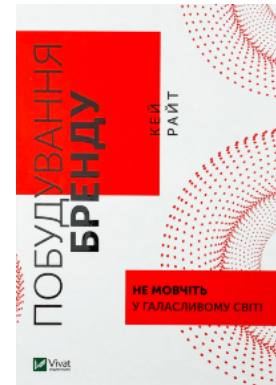
Побудування бренду: не мовчіть у галасливому світі