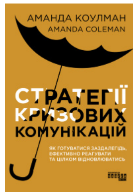
Стратегії кризових комунікацій