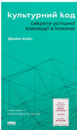
Культурний код. Секрети успішної взаємодії в команді