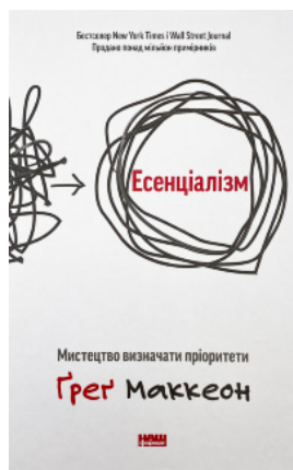
Есенціалізм. Мистецтво визначати пріоритети