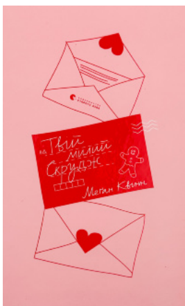
Твій милий Скрудж