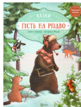
Гість на Різдво