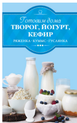
Готовим дома творог, йогурт, кефир, ряженку