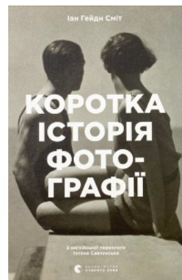
Коротка історія фотографії. Ключові жанри, роботи, теми і техніки