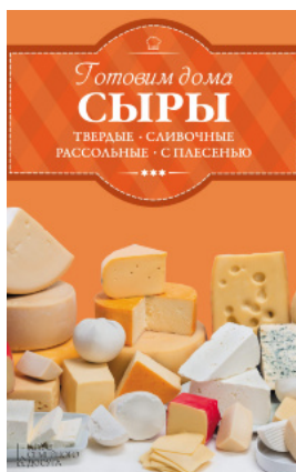
Готовим дома сыры: твердые, сливочные, рассольные, с плесенью