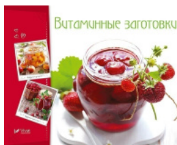
Витаминные заготовки джемы варенье