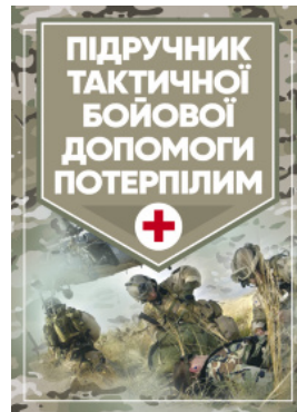
Підручник тактичної бойової допомоги потерпілим