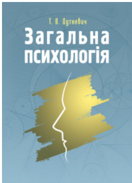
Загальна психологія. Теоретичний курс