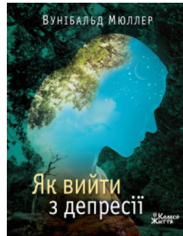
Як вийти з депресії