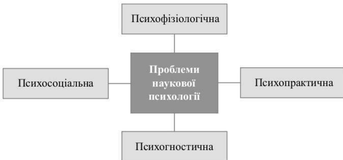
СХЕМА 1. Основні проблеми наукової психології

спостерігати лише опосередковано. Ці процеси особливо інтенсивно почали вивчати з початку ХХ ст., і вже перші результати завдали великого удару по психології свідомості.