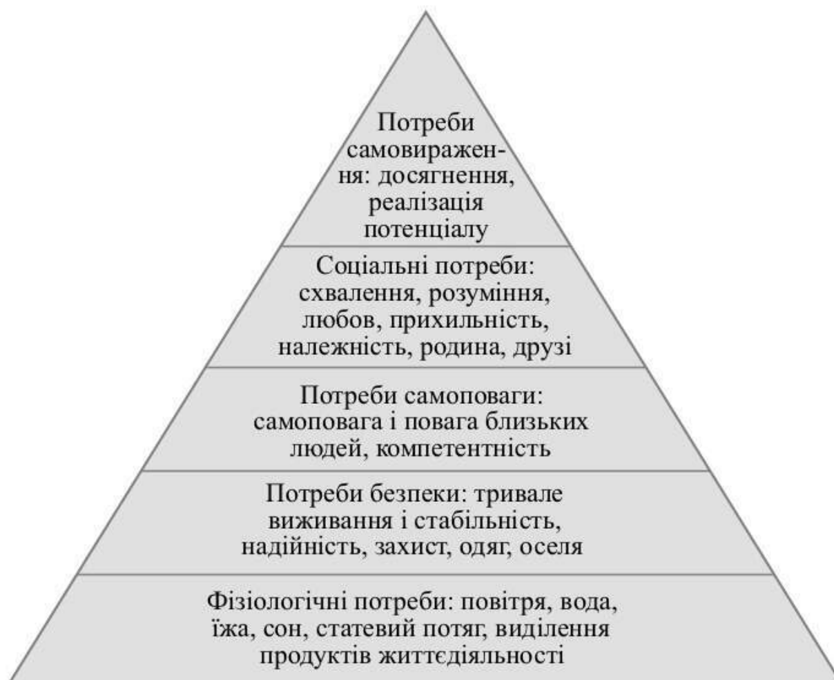
СХЕМА 4. Класифікація потреб людини за А. Маслоу

За А. Маслоу, ядро особистості утворюють гуманістичні потреби в добрі, моральності, доброзичливості, з якими людина народжується і які вона може реалізувати за певних умов. Однак ці потреби у самовираженні задовольняються лише за умов задоволення інших потреб і передусім фізіологічних (потреб у їжі, воді, повітрі, сні тощо). Наприклад, особа, яка голодує, мусить спочатку задовольнити свою потребу в їжі, а вже потім турбуватися про свою зовнішність чи житло.