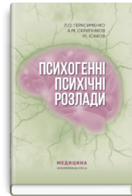
Психогенні психічні розлади: навчально-методичний посібник

Перейти до категорії Психіатрія. Наркологія