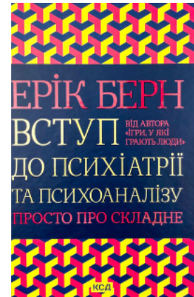
Вступ до психіатрії та психоаналізу. Просто про складне