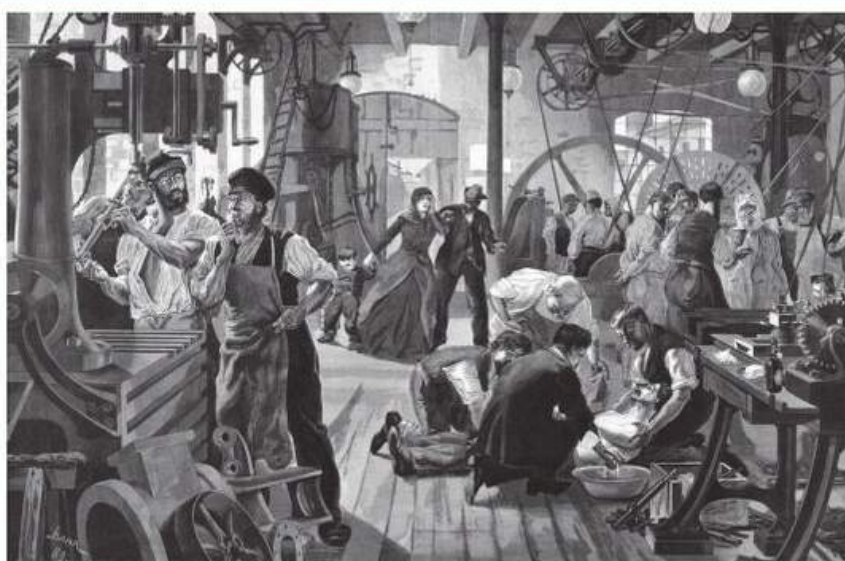
РИС. 11.1. Виробничий нещасний випадок (Йоган Бар, 1889)

Професії медичної спрямованості є одними з найбільш затребуваних та перспективних. При цьому серед усіх видів інтелектуальної праці робота медичних працівників є однією з найбільш небезпечних. Медичний персонал під час виконання своїх професійних обов'язків може підлягати одночасному впливу декількох шкідливих і небезпечних чинників різноманітного походження, що обумовлює потенційний ризик нещасних випадків, професійних захворювань, травмвань та ін. Високий рівень небезпеки наявний і під час експлуатації медичного обладнання, поводження з медичними відходами, зберігання та використання дезінфікуючих засобів, проведення поточного та генерального прибирання, санації повітря, в інших ситуаціях тощо (рис. 11.2).