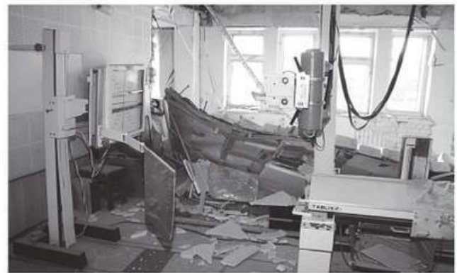
РИС. 11.5. Наслідки вибуху балону з киснево-повітряною сумішшю у Луганській міській лікарні № 7