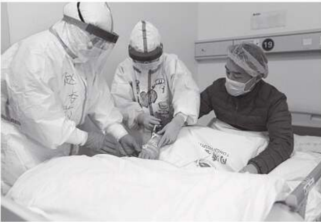
РИС. 11.4. Проведення маніпуляцій інфікованому Covid-19 хворому

дані щодо професійної захворюваності, що пов'язано з неякісним проведенням медичних оглядів та самолікуванням більшості медичних працівників.