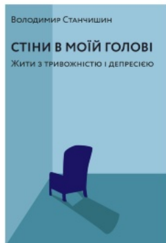
Стіни в моїй голові. Жити з тривожністю і депресією