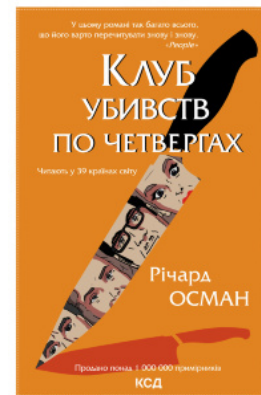
Клуб убивств по четвергах