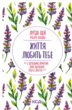
Життя любить тебе. 7 духовних практик для зцілення

Перейти до категорії Саморозвиток та мотивація