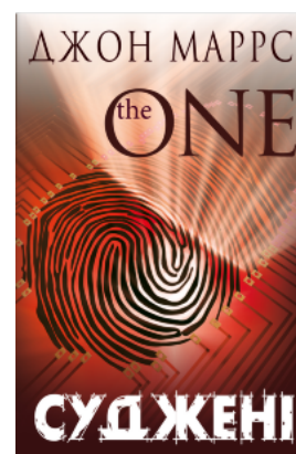
Суджені. The One