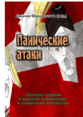
Панические атаки (Гештальт-терапия в единстве клинических и социальных контекстов)