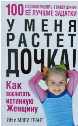
У меня растёт дочка! Как воспитать истинную женщину