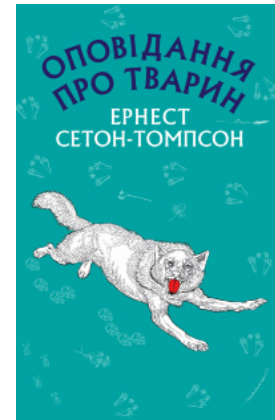
Оповідання про тварин