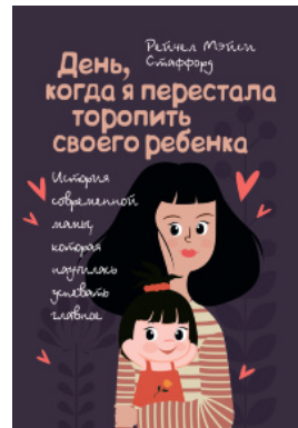
День, когда я перестала торопить своего ребенка. История современной мамы, которая научилась успевать главное!