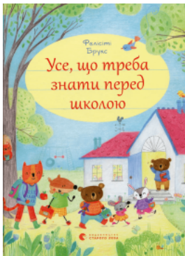
Усе, що треба знати перед школою