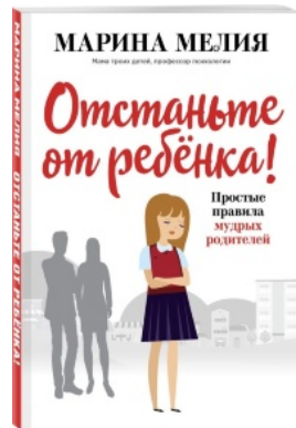
Отстаньте от ребёнка! Простые правила мудрых родителей